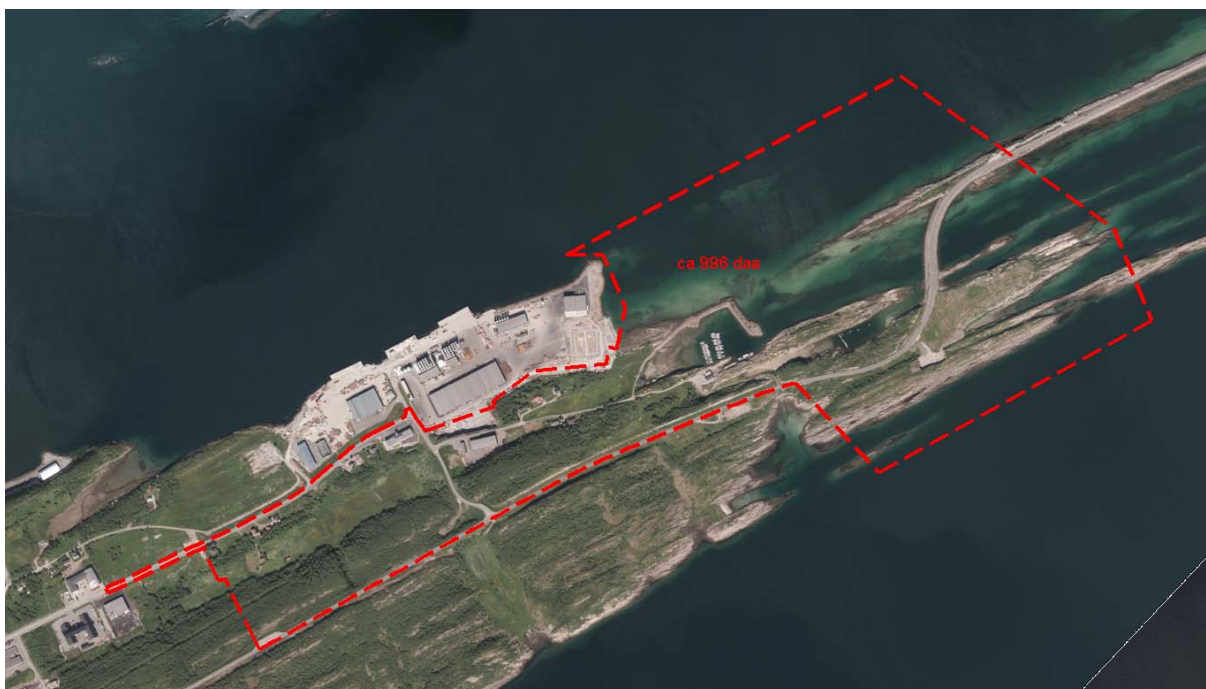
Figur 4: Oversikt over planområdet, ortofoto 2012