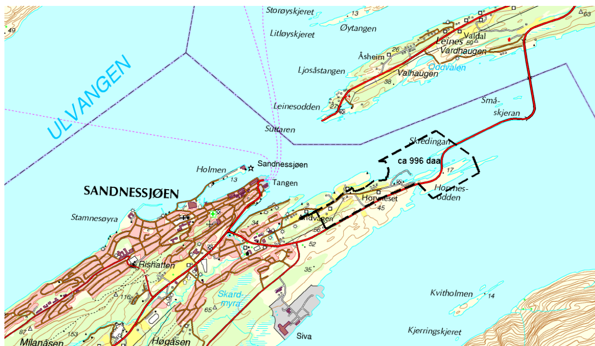
Figur 1: Planområdet er skissert med svart stiplede linje

Planarbeidet skal utføres som en områderegulering etter plan- og bygningsloven § 12-2. Reguleringsplanen skal erstatte gjeldende reguleringsplaner innenfor området.