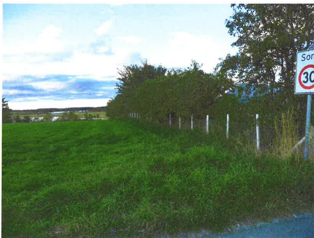
Utvidelsesmulighet mot fylkesvei 17- alternativ 2