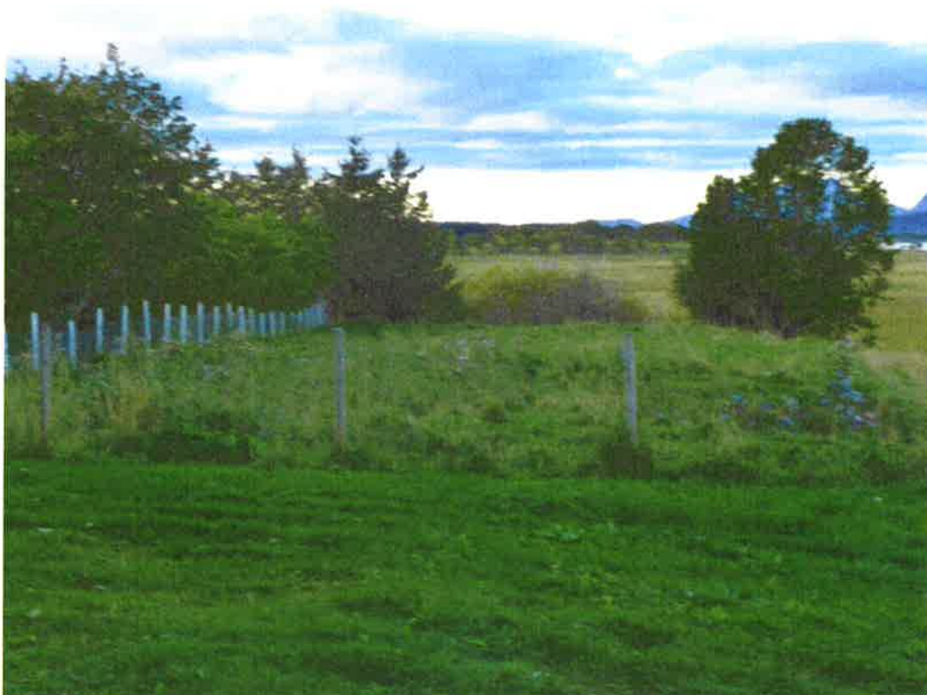
Utvidelsesmulighet mot kirka- alternativ 1